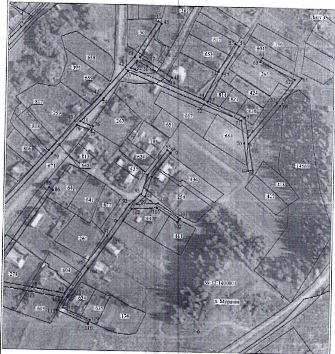
Схема расположения границ публичного сервитута объекта